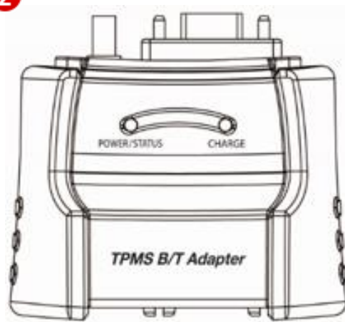
Адапте р B/T