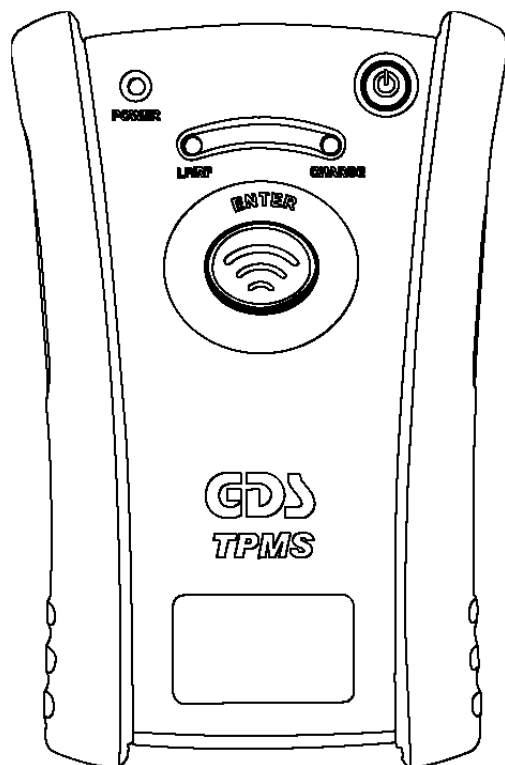
Модуль TPMS (система контрол я давлени я в шинах)